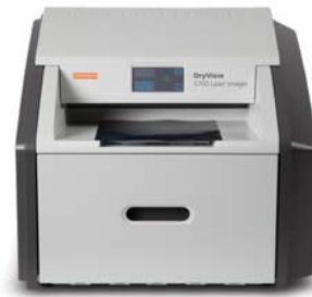
Impresora láser DRYVIEW 5700