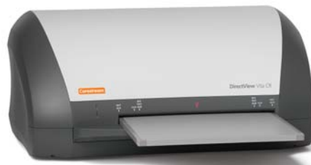
DIRECTVIEW Vita CR